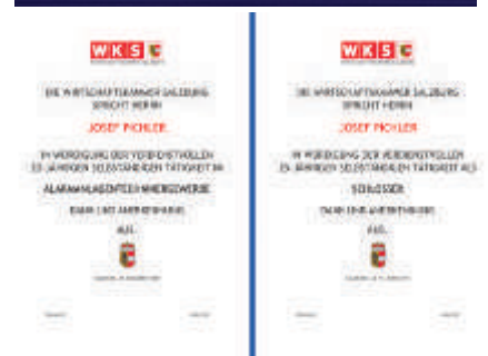
Auszeichnungen der Wirtschaftskammer Sbg.