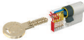
WSM - Wendeschlüsselsystem

Wir fertigen hochwertige Schließsysteme für Immobilien und entwickeln die Sicherheitslösungen der Zukunft. Als Innovationsmotor der Branche setzen wir dabei auf modernes Equipment und ein Expertenwissen, das schon heute die Marktanforderungen von morgen im Blick hat. Das überzeugt unsere Kunden in aller Welt - öffentliche und gewerbliche Auftraggeber ebenso wie private Nutzer. Individualität spielt in unserem Verständnis