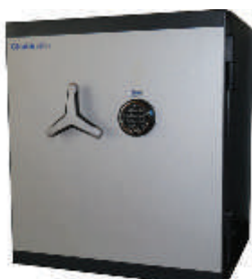
Tresor Duo Guard I 110

Was Sie schützen möchten, bleibt natürlich Ihnen überlas-