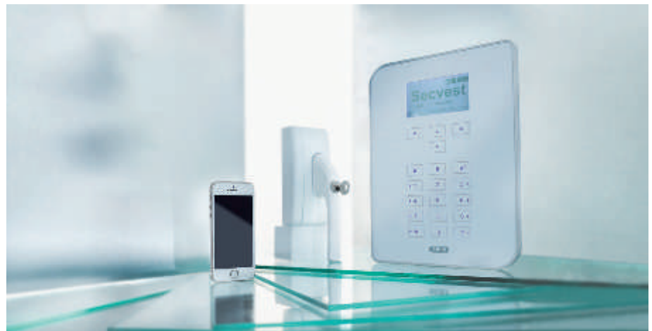
Secvest Funkalarmanlagen Set