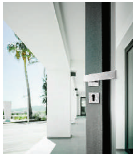
SQUARE - LSQIV Türgriff matt

FORMANI Produkte sind ausschließlich über professionelle Wiederverkäufer weltweit zu beziehen. Für Österreich hat das Unternehmen Pichler Sicherheits- und Systemtechnik Ges.m.b.H & Co KG den exklusiven Vertrieb für innovative FORMANI Produkte übernommen. Nutzen Sie unseren Musterservice auf Anfrage und lassen Sie sich von FORMANI Beschlägen überzeugen. Unser Showroom